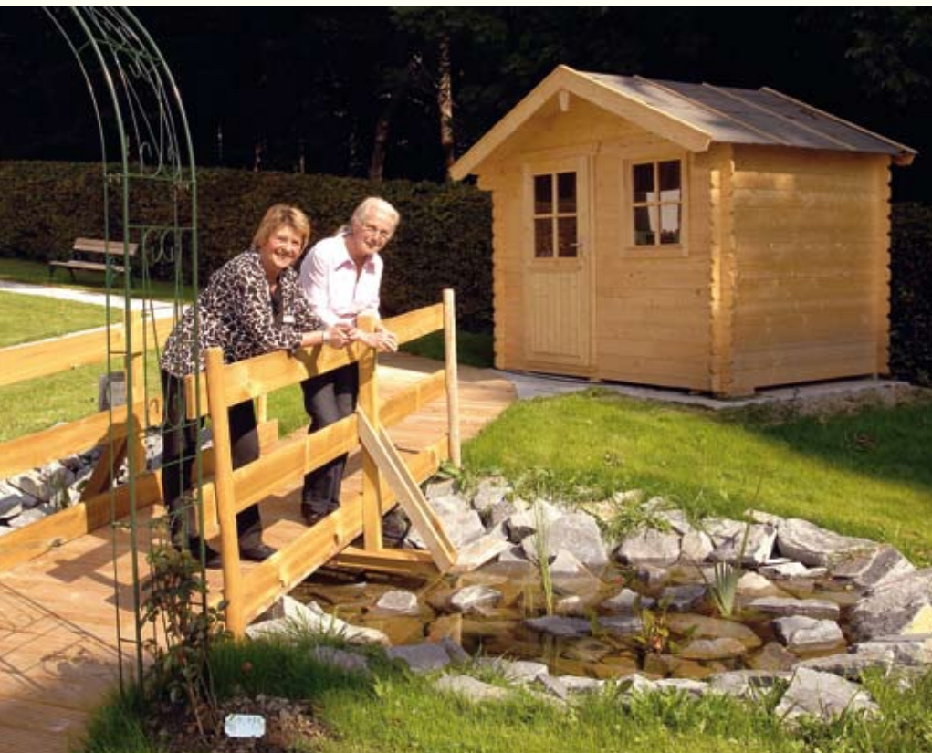
Liebevoll angelegt: Der Garten mit Teich und Brücke lädt zum Verweilen ein.

Barrierefreie Apartments, kleine Wohnbereiche und eine beschützende Abteilung: Das AWO-Seniorenzentrum Immenstadt hat viel zu bieten.